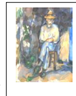
Paul Cézanne, Le Jardinier Vallier, 1906, Huile sur toile, 65 x 54 cm, Tate Modern, Londres